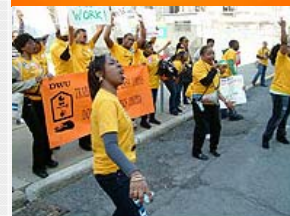
Domestic workers in New York are pressing for labor protections.